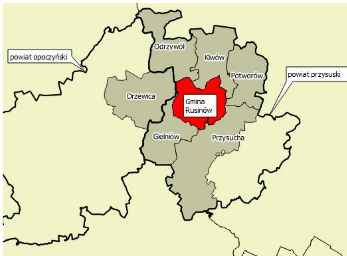
Ryc. 2. Gmina Rusinów na tle sąsiadujących gmin.

Rusinów jest otoczony lasami mieszanymi. Przez teren gminy przepływają dwie rzeki: Drzewiczka z dopływem Gawronką oraz Wiązownica będąca dopływem Radomki. Gmina Rusinów pozbawiona jest przebiegających przez jej tereny szlaków komunikacyjnych wojewódzkich i krajowych. Krzyżują się tu drogi powiatowe łączące: Przysuchę z Odrzywołem i Nowym Miastem n/Pilicą i Drzewicę z Kłwowem, Przytykiem i Radomiem.