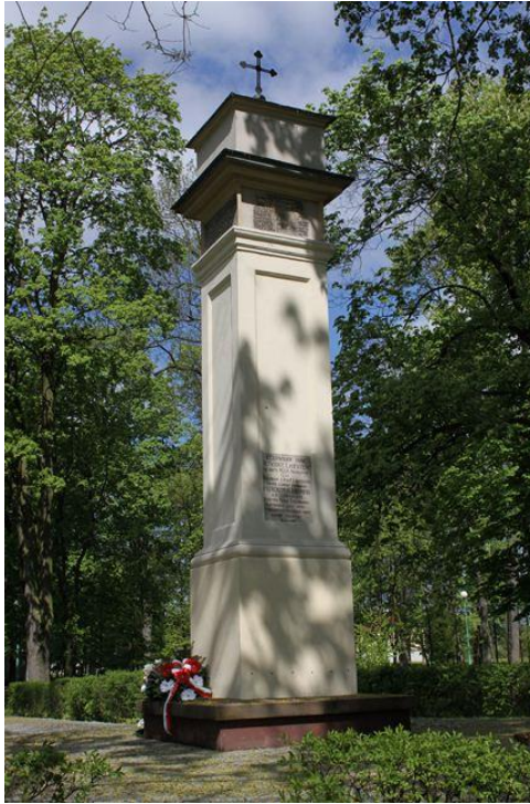
Rysunek 2. Kolumna upamiętniająca narodziny króla Zygmunta I Starego z początku XVI wieku.

Cenne elementy wyposażenia znajdują się w kościele pw. Św. Krzyża w Kozienicach. Należą do nich: