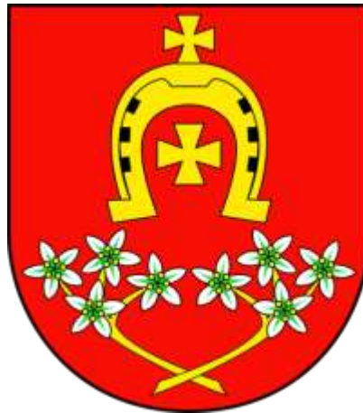
Ryc. 4. Herb Gminy Czerwin

Czerwin jest starą wsią, założoną w 1389 r. przez braci Kajmów, którzy grunty w Niestępowie koło Zakroczymia zamienili z księciem mazowieckim Januszem I Starszym na grunty czerwińskie ziemi nurskiej. Założona przez Kajmów osada szybko się rozwijała. Pierwszy kościół zbudowano około roku 1428, a w średniowieczu przy kościołach zaczęły powstawać szkoły parafialne, w których kształciła się młodzież z sąsiednich zaścianków szlacheckich. 12 Od XVI w. wieś słynęła z Jarmarków Czerwińskich, jednak na pewien czas impreza została zapomniana a następnie reaktywowana na początku XXI w. Innym lokalnym wydarzeniem są Dni Kukurydzy, w nawiązaniu do bardzo popularnego zboża w tej części powiatu ostrołęckiego.