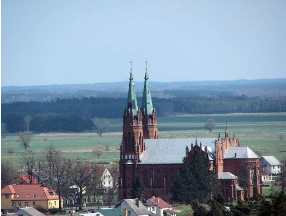
Fot. 1. Neogotycka świątynia pw. Narodzenia NMP w Baranowie

W miejscowości Baranowo zachowały się również drewniane kurpiowskie domy, jednak w obecnym stanie pozbawione są już regionalnych elementów ozdobnych. W okresie międzywojennym uporządkowano stary cmentarz - usypując kopiec z ziemi zawierającej szczątki pochowanych, a wzgórze zwieńczono figurą Chrystusa niosącego krzyż. 10