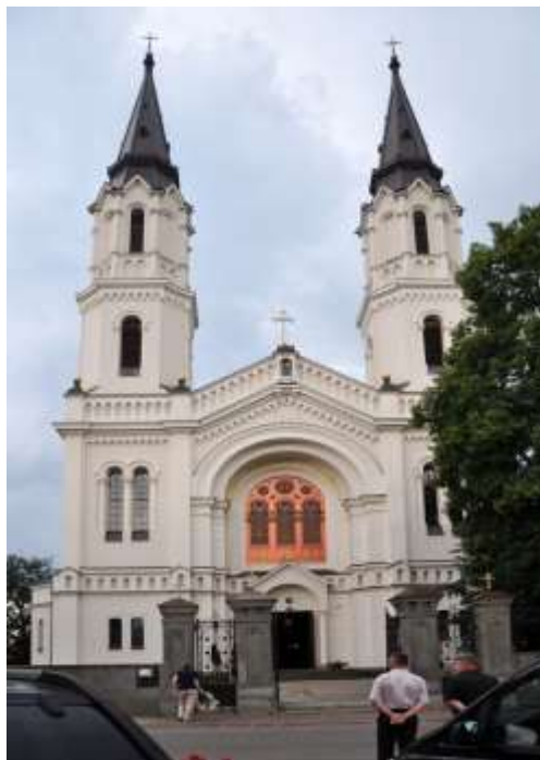
Fot. 7. Kościół pw. Podwyższonego Krzyża Świętego w Goworowie

W elementach świątyni dominują cechy stylu neoromańskiego i neogotyckiego, a przykryte sklepieniem krzyżowym wewnątrz podzielone zostało filarami arkadowymi na 3 nawy. W ołtarzach bocznych znajdują się obrazy namalowane przez Wojciecha Gersona, a w kaplicy Glinków umieszczono marmurowe popiersie i epitafium Mikołaja Glinki - właściciela Szczawina. W kościele upamiętniono również innych okolicznych właścicieli ziemskich. Obok kościoła stoi plebania z 1922 r. wzorowana na architekturze dworskiej. W latach 30 XIX w. wytyczono nowy cmentarz, a w 1855 r. wzniesiono na nim kaplicę grobową Górskich , właścicieli Ponikwi Małej, Gór i Jemielistego.