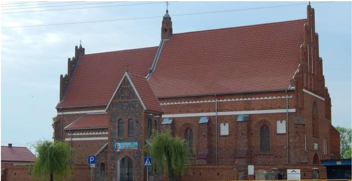
Fot. 25. Kościół św. Wawrzyńca w Kleczkowie