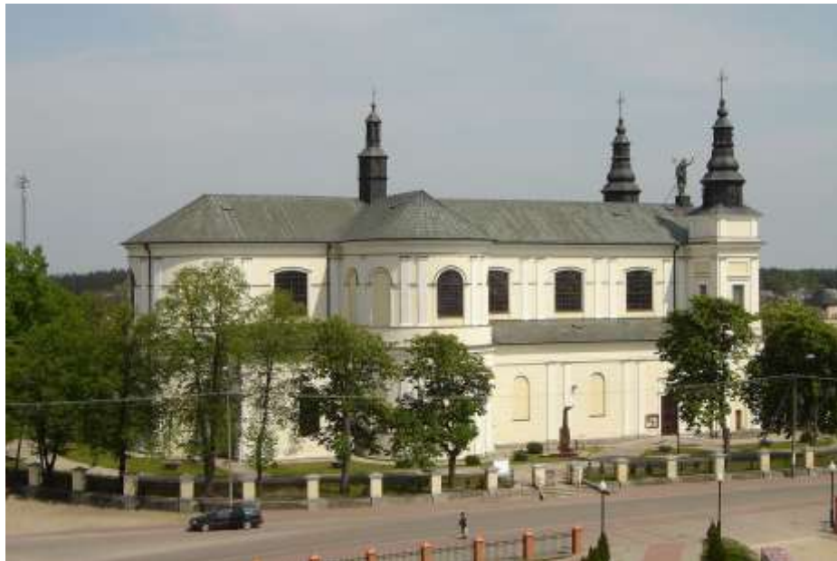
Fot. 11. Kościół pw. Ducha Świętego w Kadzidle