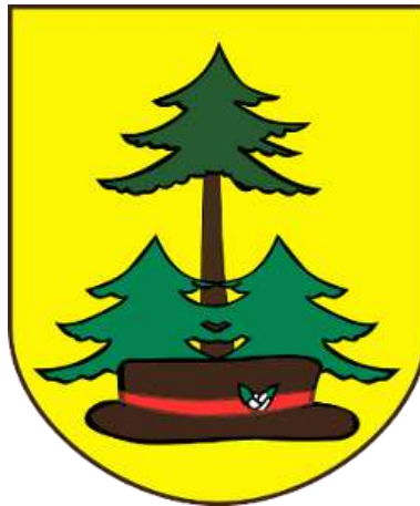
Ryc. 7. Herb Gminy Lelis

Lelis - wieś otoczona leśnymi wydmami. Powstała w miejscu kuźnicy żelaza zwanej Rudą Lelis założonej w XVII w. Badania archeologiczne wykazały jednak, iż ludzie przebywali w tej okolicy już 6 tysięcy lat temu. W miejscowości znajduje się drewniany kościół, który jest siedzibą parafii Matki Bożej Nieustającej Pomocy. Zbudowano go w 1948 r. w Nowej Wsi, a do Lelisa przeniesiono w 1987 r. W Lelisie odbywa się jedna z najciekawszych imprez folklorystycznych na Kurpiach - „Kurpiowskie Granie w Lelisie” Regionalny Przegląd Harmonistów i Skrzypków Ludowych. 21