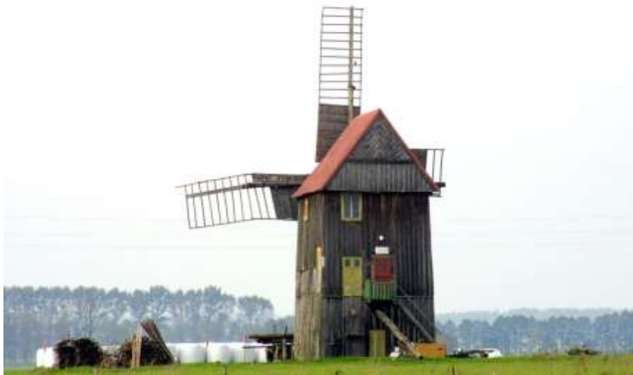
Fot. 18. Wiatrak w Lipnikach

Lipnicki wiatrak (typu koźlak) został zbudowany w XIX w., a następnie odbudowany po zniszczeniach z czasów I wojny światowej. Drugi młyn wiatrowy stoi na południe od Lipnik.