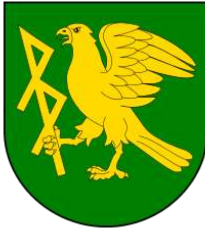
Ryc. 3. Herb gminy Baranowo