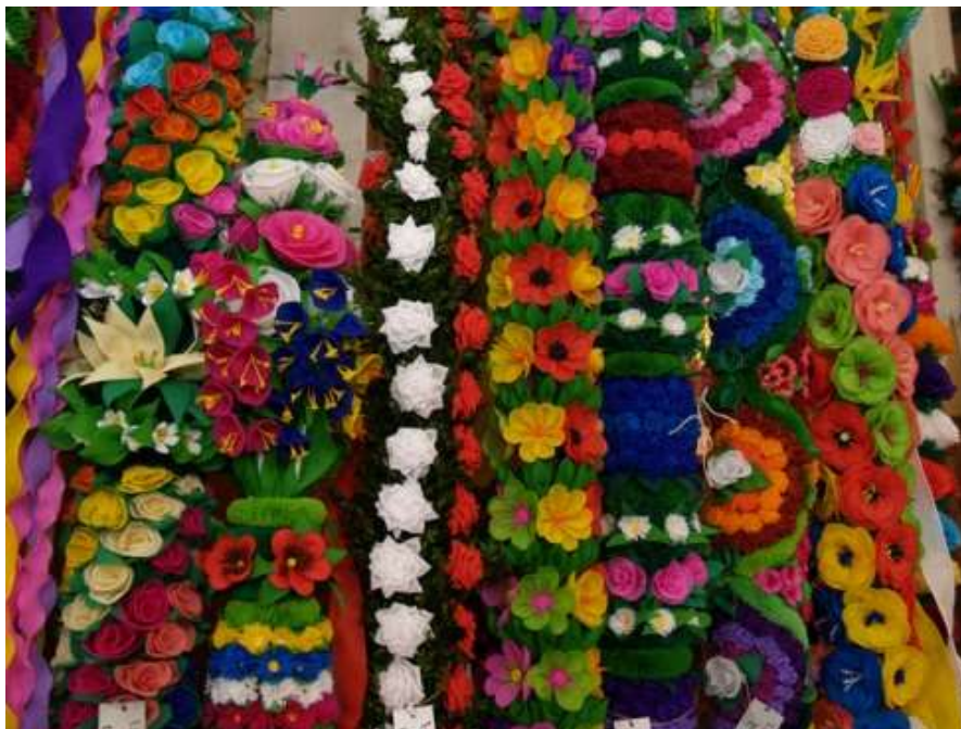
Fot. 15. Niedziela Palmowa w Łysych

Łyse to wieś znana już od XVIII w. Jednym z mieszczących się tutaj tradycyjnych budynków kurpiowskiej zabudowy jest drewniany kościół pw. św. Anny wzniesiony w 1882 r. na miejscu kaplicy z 1789 r. We wnętrzu świątyni znajdują się zabytkowe feretrony i rzeźby z końca XIX w., jak również obrazy przedstawiające Marię i Magdalenę w strojach kurpiowskich oraz Chrystusa, który dźwiga krzyż wspomagany przez mężczyznę w kurpiowskim ubraniu. Kościół zdobią również palmy kurpiowskie, będące owocem corocznych konkursów. Obok kościoła stoi drewniana dzwonnica z końca XIX w. oraz krzyż powstańczy z 1863 r. Świątynię otacza wieniec kapliczek słupowych z polichromowanymi płaskorzeźbami . Od 2000 r. kościół nie pełni funkcji sakralnych, albowiem przejęła je świątynia pw. Chrystusa Króla Wszechświata.