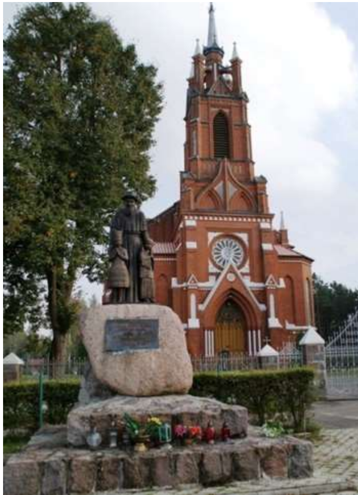
Fot. 3. Kościół pw. Niepokalanego Poczęcia NMP w Czarni