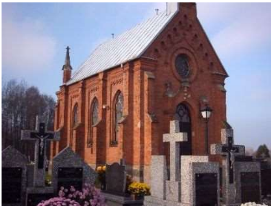
Fot.5. Neogotycka kaplica grobowa Andlauerów