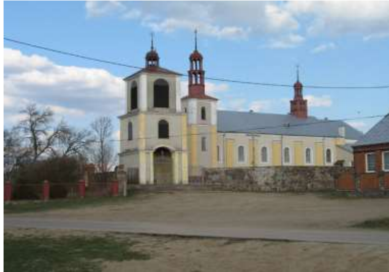
Fot. 17. Kościół pw. Najświętszego Serca Jezusowego w Lipnikach

Lipnicki wiatrak (typu koźlak) został zbudowany w XIX w., a następnie odbudowany po zniszczeniach z czasów I wojny światowej. Drugi młyn wiatrowy stoi na południe od Lipnik.