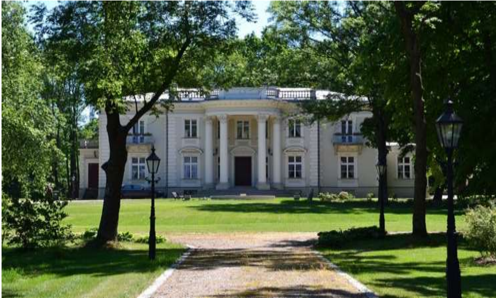
Fot. 10. Pałac w Brzeźnie