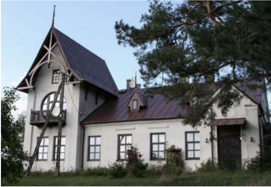
Fot. 21. Plebania w Nowej Wsi

Na terenie gminy znajdują się również krzyże, kapliczki, cmentarze, mogiły i miejsca pamięci narodowej, w tym mogiła zbiorowa i krzyże przydrożne w Żebrach Chudek, kapliczka w Zabrodziu i kapliczka w Nowej Wsi, cmentarz wojenny żołnierzy niemieckich i rosyjskich w Żebrach - Starej Wsi.