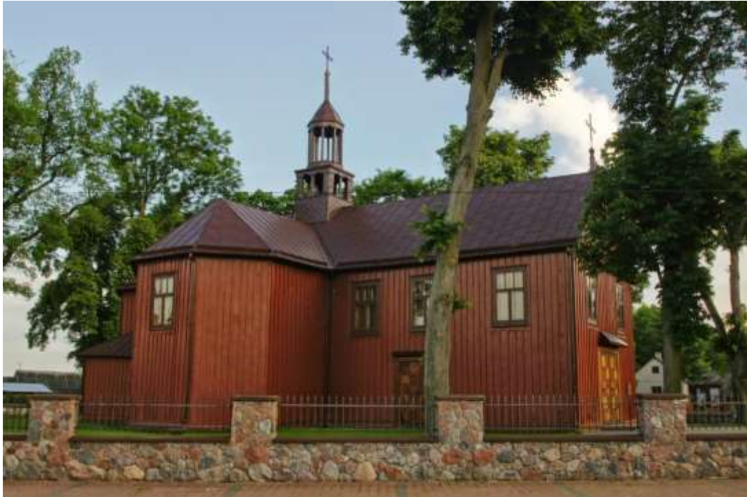
Fot. 2. Drewniany kościół w Brodowych Łąkach

W Zawadach działa Regionalny Zespół Pieśni i Tańca Zawady – najstarsza grupa muzyczna na Kurpiach. Architekturę Brodowych Łąk i Zawad dopełniają kurpiowskie drewniane domy. Wokół obu wsi roztacza się Dolina Omulwi i Płodownicy (obszar Natura 2000).