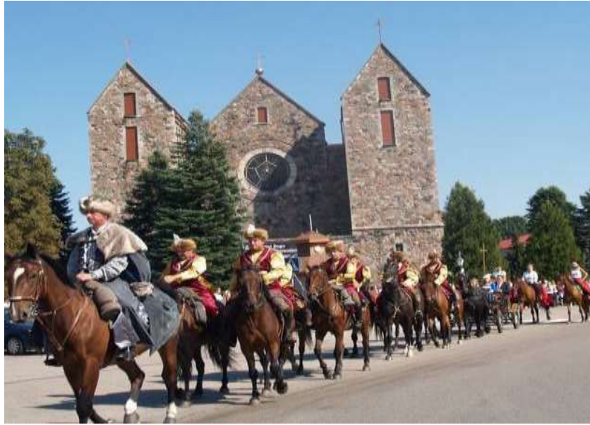
Fot. 24. Zajazd Szlachecki w Troszynie

Troszyn jest również siedzibą Lokalnej Grupy Działania „Zaścianek Mazowsze”, która zrzesza gminy o tradycji szlacheckiej. Kultywowanie i pielęgnowanie tradycji odbywa się również poprzez organizowanie imprez kulturalnych, np. „Zjazd Szlachecki w Troszynie”.