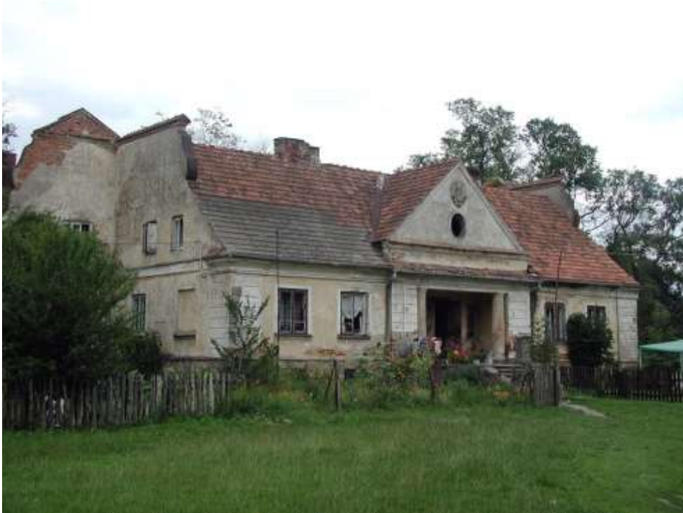
Fot. 23. Dwór w Susku Starym