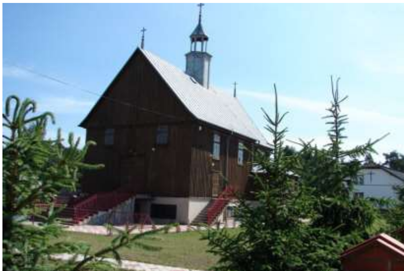
Fot. 13. Kościół Matki Bożej Nieustającej Pomocy w Lelisie

Lelis - wieś otoczona leśnymi wydmami. Powstała w miejscu kuźnicy żelaza zwanej Rudą Lelis założonej w XVII w. Badania archeologiczne wykazały jednak, iż ludzie przebywali w tej okolicy już 6 tysięcy lat temu. W miejscowości znajduje się drewniany kościół, który jest siedzibą parafii Matki Bożej Nieustającej Pomocy. Zbudowano go w 1948 r. w Nowej Wsi, a do Lelisa przeniesiono w 1987 r. W Lelisie odbywa się jedna z najciekawszych imprez folklorystycznych na Kurpiach - „Kurpiowskie Granie w Lelisie” Regionalny Przegląd Harmonistów i Skrzypków Ludowych. 21