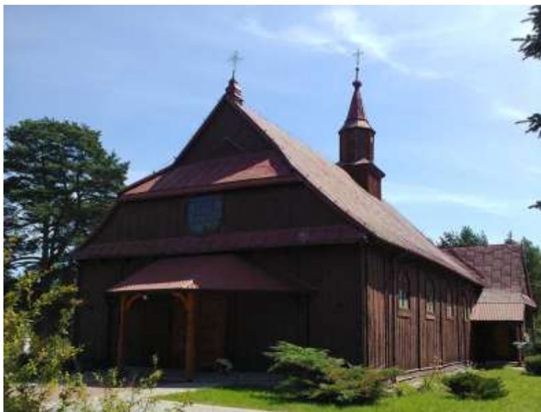
Fot. 12. Kościół św. Michała Archanioła w Czarni (gm. Kadzidło)