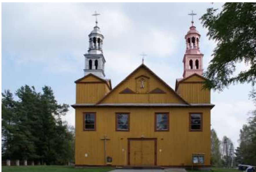
Fot. 14. Kościół p.w. św. Anny w Dąbrówce

Elewacja frontowa wraz z ludowym krucyfiksem przypomina ścianę szczytową domu kurpiowskiego. Wnętrze świątyni wyróżnia się pięknymi obrazami, licznymi krucyfiksami oraz barokowo-ludową rzeźbą Matki Boskiej z Dzieciątkiem. Obok kościoła stoi 13-metrowa drewniana dzwonnica i kapliczka.