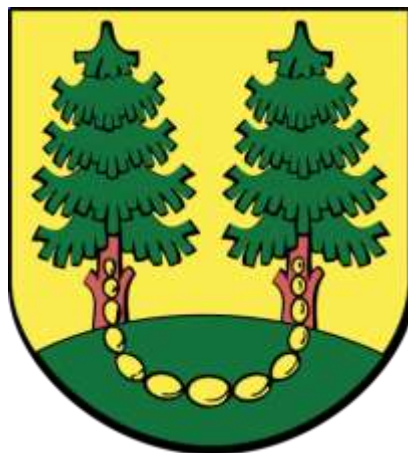
Ryc. 6. Herb Gminy Kadzidło

Gmina Kadzidło zajmuje obszar 259 km 2 i pod względem powierzchni znajduje się na 3 miejscu w województwie, będąc jednocześnie największą gminą w powiecie ostrołęckim. Gmina położona jest w sercu Puszczy Zielonej. Lasy stanowią około 100 km 2 gminy, a użytki rolne 140 km 2 (z czego 55% powierzchni użytków rolnych stanowią użytki zielone). Głównym źródłem utrzymania rolników jest produkcja dobrej jakości mleka i żywca wołowego. Rozległe kompleksy leśne w połączeniu z urozmaiconą rzeźbą terenu, tworzą korzystne warunki klimatyczno-zdrowotne. Natomiast rzeki: Rozoga, Omulew i Szkwa, bogata fauna i flora, stwarzają dobre warunki do wypoczynku, wędkowania, turystyki wodnej i rowerowej.