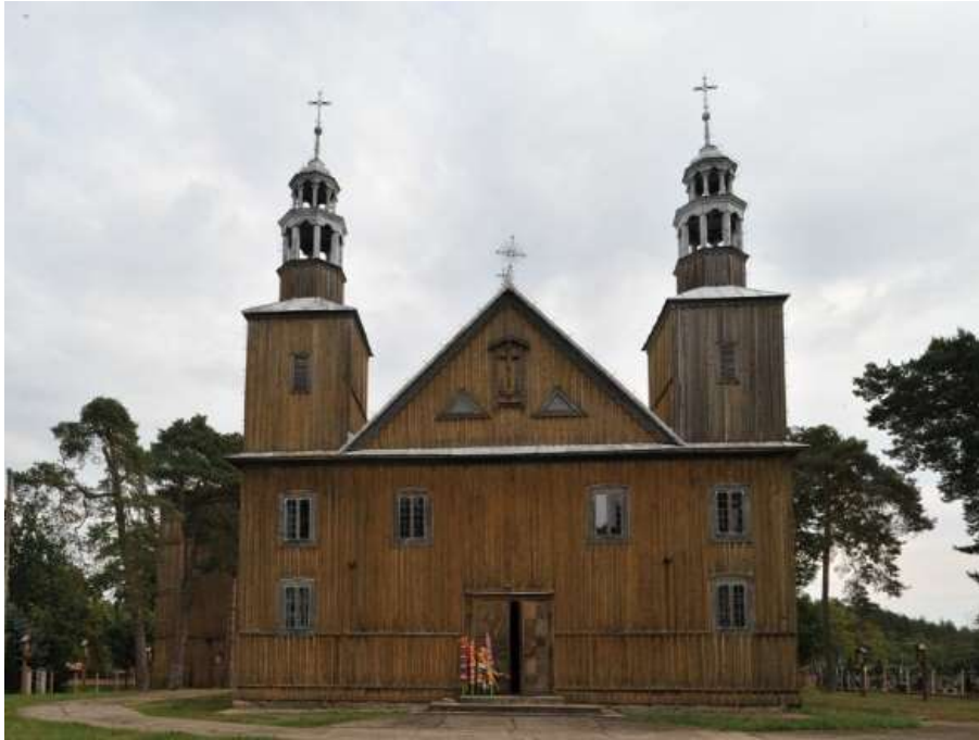
Fot. 16. Kościół pw. św. Anny w Łysych

Lipniki są dużą wsią, która powstała w 1663 r. Najprawdopodobniej założycielem był szlachcic, uciekinier z okolic Piotrkowa Trybunalskiego, o nazwisku Wiśniewski, który założył osadę, a następnie zarejestrował jako wieś i przyjął prawo bartne, włączając wieś do parafii rzymskokatolickiej w Nowogrodzie. Następnie zaczęła napływać fala osadników z różnych terenów Polski. W Lipnikach przed 1865 r. utworzono jedną z trzech pierwszych szkół na Kurpiach, a w 1883 r. parafię. Obecnie wieś znana jest głównie z jedyne go na Kurpiach kompletnego wiatraka, kościoła, fabryki mebli oraz gospodarstw agroturystycznych. Kościół pw. Najświętszego Serca Jezusowego zbudowano w latach 1837-1889 na planie prostokąta z trójbocznie zamkniętym prezbiterium i dobudowanymi dwoma pomieszczeniami. Zabytkowa jest również dzwonnica murowana pochodząca z I połowy XIX wieku. Naprzeciw kościoła stoi figura św. Rocha , pochodząca z XIX w.