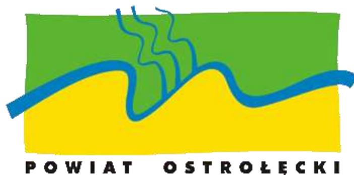
Ryc. 2. Logo powiatu ostrołęckiego

Powiat ostrołęcki nie ma swojego herbu, jednakże podjęto próby jego opracowania. Aktualnie projekt został zatwierdzony przez władze powiatu i opiniowany jest przez Komisję Heraldyczną. Natomiast logo powiatu ostrołęckiego koresponduje z jego geograficznym położeniem i charakterystyką terenu. Północna część powiatu oznaczona została kolorem zielonym, symbolizującym Puszcze Kurpiowską, południowa - kolorem żółtym, symbolizującym bogactwo pól zbożowych. Kolory mają również wyraz socjologiczny: zielony - kojarzony jest ze spokojem, stabilizacją, nadzieją, zaś żółty (ciepły) - ze stałością, mądrością, błyskotliwością oraz cierpliwością i wytrwałością. Pozioma niebieska wstęga symbolizuje rzekę Narew, natomiast pionowe - rzeki: Omulew, Rozogę i Szkwę, które płyną równoległe do siebie.