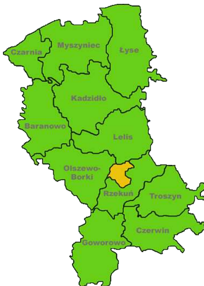
Ryc. 1. Powiat ostrołęcki w układzie gmin

Obszar administracyjny powiatu obejmuje 11 gmin, w tym jedną gminę miejsko-wiejską Myszyniec oraz dziesięć gmin wiejskich: Baranowo, Czarnia, Czerwin, Goworowo, Kadzidło, Lelis, Łyse, Olszewo-Borki, Rzekuń i Troszyn. Najmniejszą gminą jest Czarnia, a największą Kadzidło. W powiecie ostrołęckim znajduje się 308 sołectw.