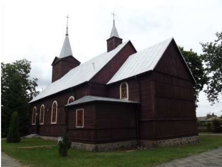
Fot. 9. Kościół św. Jana Chrzciciela w Kuninie

i sygnaturkę, a świątyni nadano wezwanie Niepokalanego Poczęcia NMP. W sąsiednich wsiach - w Dzbądku i Wólce Kunińskiej - znajdują się cmentarze wojenne z 1915 r.