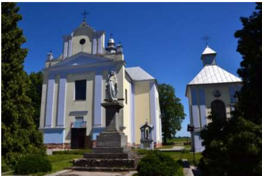
Fot. 4. Kościół pw. Trójcy Przenajświętszej w Czerwinie

Czerwin jest starą wsią, założoną w 1389 r. przez braci Kajmów, którzy grunty w Niestępowie koło Zakroczymia zamienili z księciem mazowieckim Januszem I Starszym na grunty czerwińskie ziemi nurskiej. Założona przez Kajmów osada szybko się rozwijała. Pierwszy kościół zbudowano około roku 1428, a w średniowieczu przy kościołach zaczęły powstawać szkoły parafialne, w których kształciła się młodzież z sąsiednich zaścianków szlacheckich. 12 Od XVI w. wieś słynęła z Jarmarków Czerwińskich, jednak na pewien czas impreza została zapomniana a następnie reaktywowana na początku XXI w. Innym lokalnym wydarzeniem są Dni Kukurydzy, w nawiązaniu do bardzo popularnego zboża w tej części powiatu ostrołęckiego.