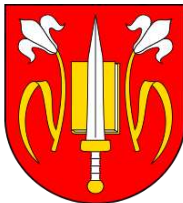
Ryc. 10. Herb Gminy Rzekuń

Gmina Rzekuń leży pomiędzy obszarami silnego wpływu kultury kurpiowskiej. Większość miejscowości jest utożsamiana raczej z tradycjami „włociańskimi”. 35 Aktualnie korzystne położenie gminy, wzdłuż tras: Warszawa - Suwałki i Ostrołęka - Ostrów Mazowiecka oraz w sąsiedztwie miasta Ostrołęki, zapewnia dobre warunki dla rozwoju różnych gałęzi przemysłu i handlu.