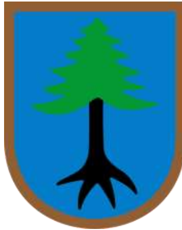
Ryc. 8. Herb Gminy Myszyńiec

o wyzwolenie narodowe). Za udział w powstaniu styczniowym Myszyńcowi odebrano prawa miejskie, które odzyskał dopiero w 1993 r. 25