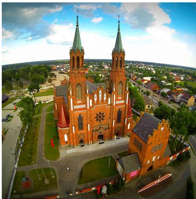
Fot. 19. Kościół parafialny p.w. Trójcy Przenajświętszej w Myszyncu

W kontekście zabytków miasta należy również wymienić starą część cmentarza parafialnego rzymsko-katolickiego i pomnik powstańców z 1863 r, pomnik upamiętniający walki ze Szwedami, były cmentarz żydowski z początku XIX w. oraz liczne drewniane domy pochodzące z końca XIX i początku XX wieku. 28