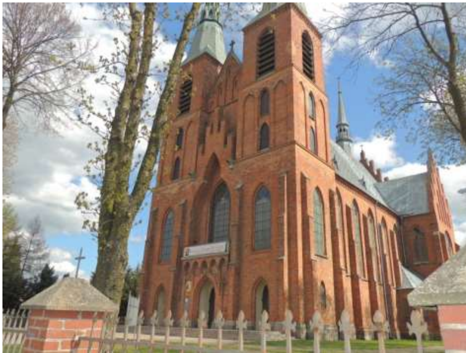
Fot. 22. Kościół p.w. Najświętszego Serca Jezusowego w Rzekuniu

z lat 20 oraz neogotyckie ołtarze boczne sprzed II wojny światowej oraz okresu powojennego. 36