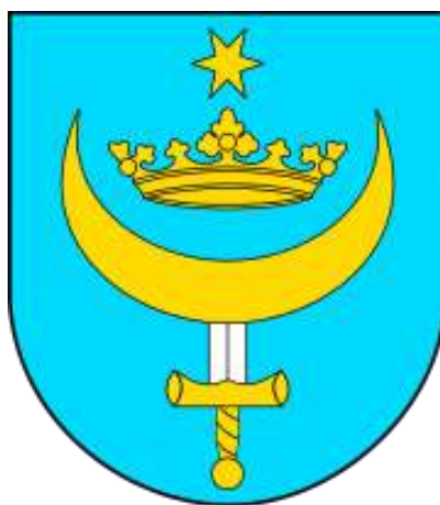
Ryc. 5. Herb Gminy Goworowo

1807-1815 należały do Księstwa Warszawskiego. Od 1815 r. do odzyskania niepodległości znalazły się w zaborze rosyjskim w guberni łomżyńskiej. Na przestrzeni wieków tereny obecnej gminy Goworowo były świadkami wielu tragicznych wydarzeń. W czasie I wojny światowej większość wsi gminy Goworowo została całkowicie zniszczona, a na przełomie lipca i sierpnia 1915 roku miała tu miejsce dwutygodniowa bitwa między Niemcami i Rosjanami, po której pozostało na terenie gminy 26 cmentarzy wojennych. W czasie II wojny światowej w dniu 9 września oddział SS spacyfikował Goworowo. Podpalono zabudowania, zabijając przy tym około 65 Żydów i 35 Polaków. Po wojnie nadszedł czas na odbudowę i trudny okres Polski Ludowej. 16