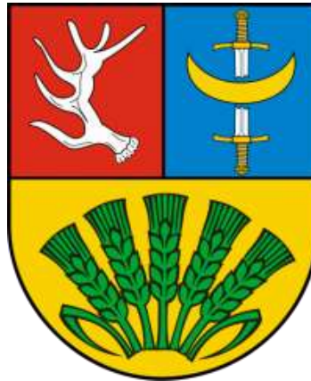
Ryc. 11. Herb Gminy Troszyn

nieregulowanej jazdy konnej stworzonej przez Aleksandra Lisowskiego złożonej ze szlachty polskiej, kozaków znad Dniepru i Zaporozża). 38