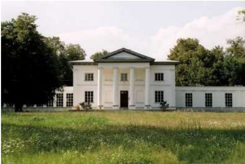
Fot. 8. Pałac w Szczawinie

który został wyregulowany w 1898 r. pod kierunkiem Waleriana Kronenberga. Około 2 km od pałacu zaczyna się kompleks leśny zwany Lasami Szczawińskimi.