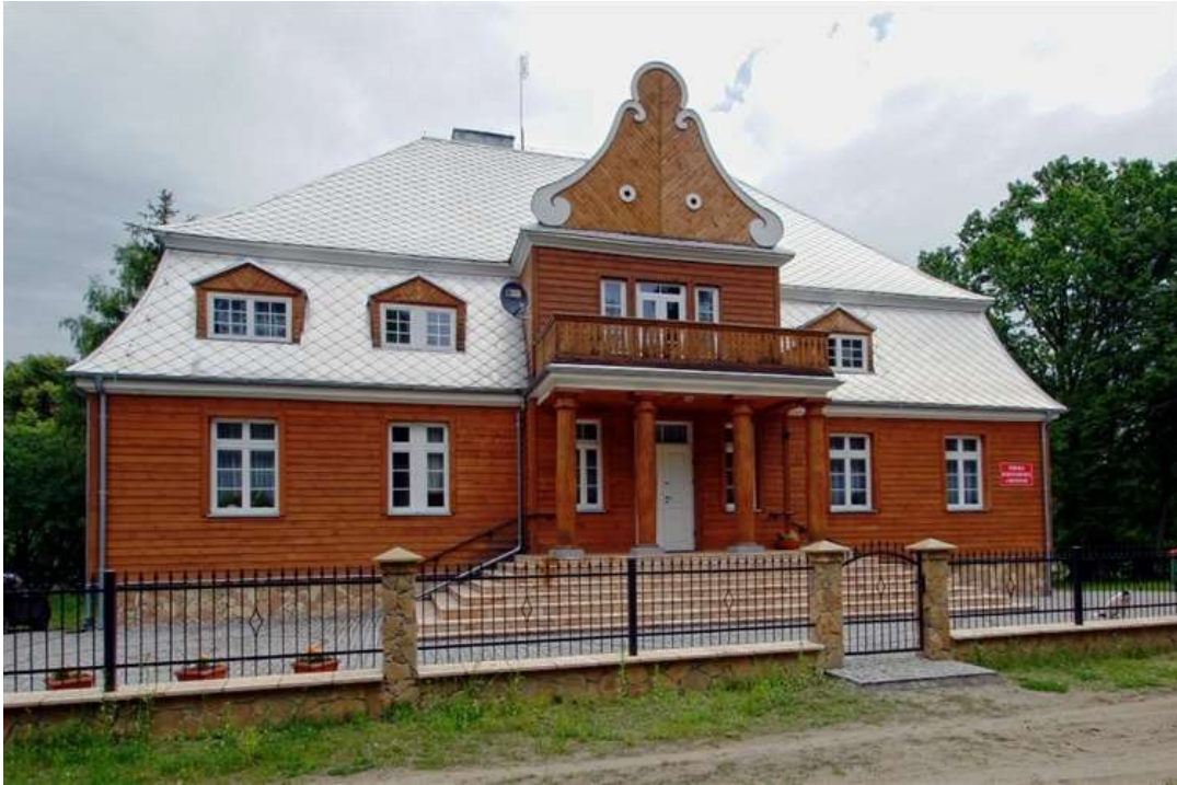
Fot. 20. Drewniany dworek w Przystani