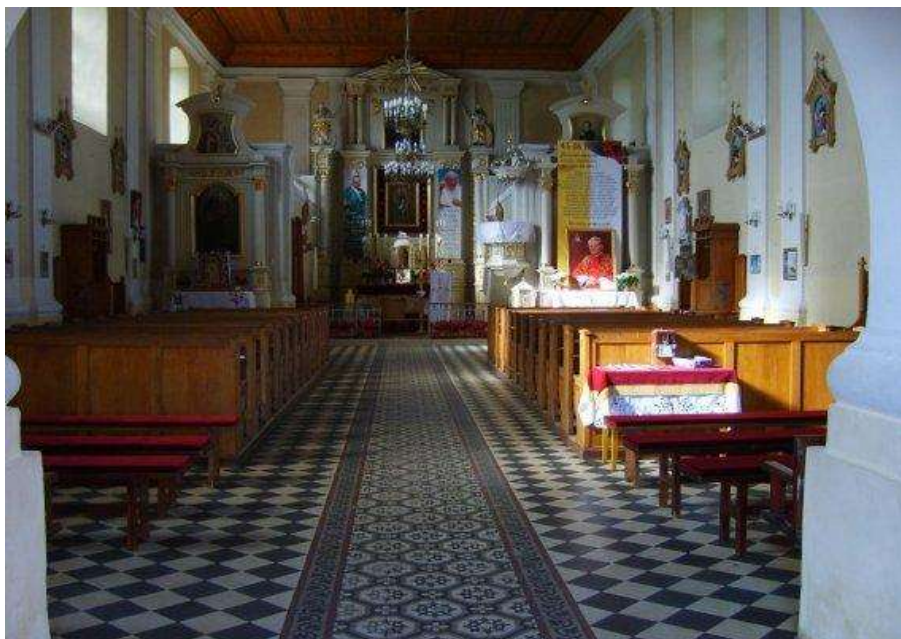
Fot. 6. Wnętrze barokowego kościoła z 1791 roku w Piskach

księdza proboszcza Mariana Boreckiego, przeprowadzono remont dachu i konserwację ołtarzy. 15