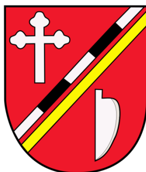
Rys 1. Herb Gminy Halinów

Herb Gminy Halinów posiada w polu czerwonym dwie pręgi tworzące pas z lewa w skos – czarno-biała (czarno-srebrna) i żółta (złota). W lewym górnym rogu tarczy krzyż biały (srebrny), w prawym dolnym lemiesz (krój) biały (srebrny).