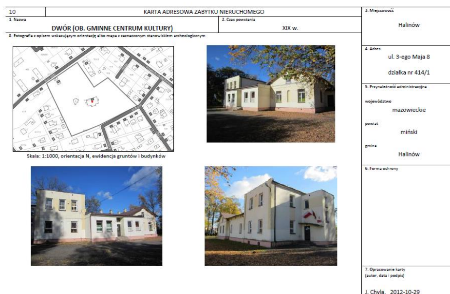
Rys. 2. Przykładowa karta gminnej ewidencji zabytków Gminy Halinów

kolorystkę stolarki i elewacji. W remontach obiektów należy stosować materiały tradycyjne, używane w pracach konserwatorskich; dopuszczalna jest wymiana stolarki na analogiczną. Obowiązuje zakaz termomodernizacji budynków, zwłaszcza z elewacjami ceramicznymi oraz wieszania billboardów (dopuszczalne jest jedynie umieszczanie reklam informacyjnych o usługach w parterach budynków, w sposób harmonizujący z zabudową). W parkach i tym podobnych założeniach ochronie podlega układ kompozycyjny, zieleń i mała architektura, a na cmentarzach - ich układ, zieleń komponowana, krzyże, figury i nagrobki sprzed 1945 r. W zespołach urbanistycznych ochronie podlega zieleń towarzysząca. Prace mogące mieć wpływ na elementy chronione wymagają opinii konserwatora (z wyjątkiem pochówków na cmentarzach).