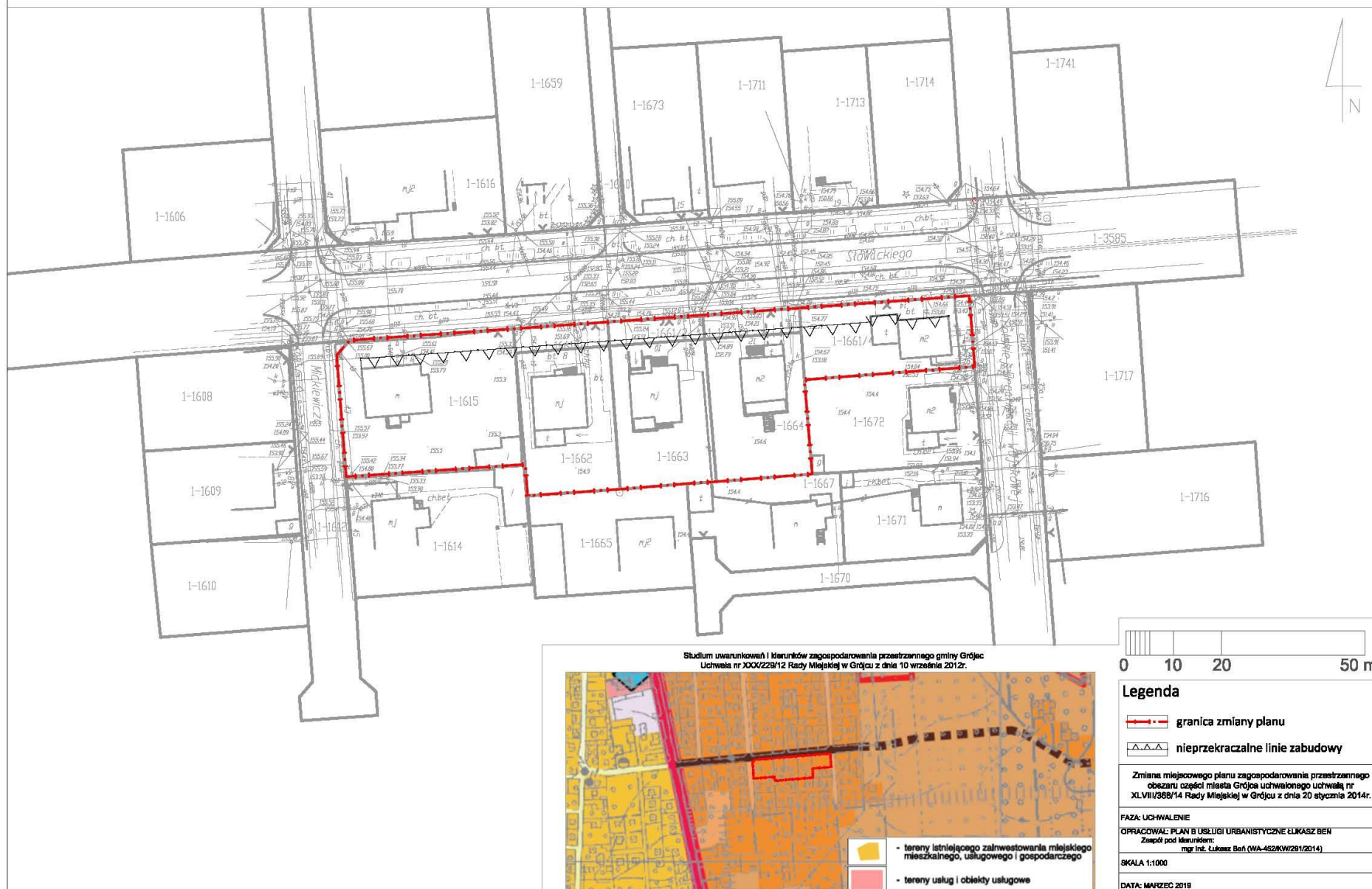
Studium uwarunkowań i kierunków zagospodarowania przestrzennego gminy Grójec Uchwała nr XXX/229/12 Rady Miejskiej w Grójcu z dnia 10 września 2012r.

Załącznik nr 1 do Uchwały nr VI/46/19 Rady Miejskiej w Grójcu z dnia 25 marca 2019 r.