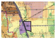
Granice terenu objętego planem

Wyrus ze studium uwarunkowań i kierunków zagospodarowania przestrzennego gminy Suchozębry - Kierunki Uchwała Nr XIII/84/2012 Rady Gminy Suchozębry z dnia 29 czerwca 2012 r.