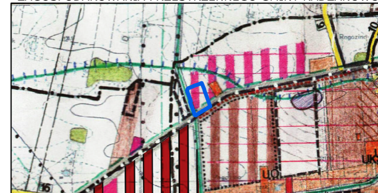
WYRYS ZE STUDIUM UWARUNKOWAŃ I KIERUNKÓW ZAGOSPODAROWANIA PRZESTRZENNEGO GMINY RADZANOWO

obszar objęty planem tereny z dominacją zabudowy usługowej i produkcyjno - składowo - magazynowej