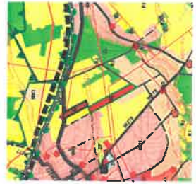
Granice obszaru objętego planem