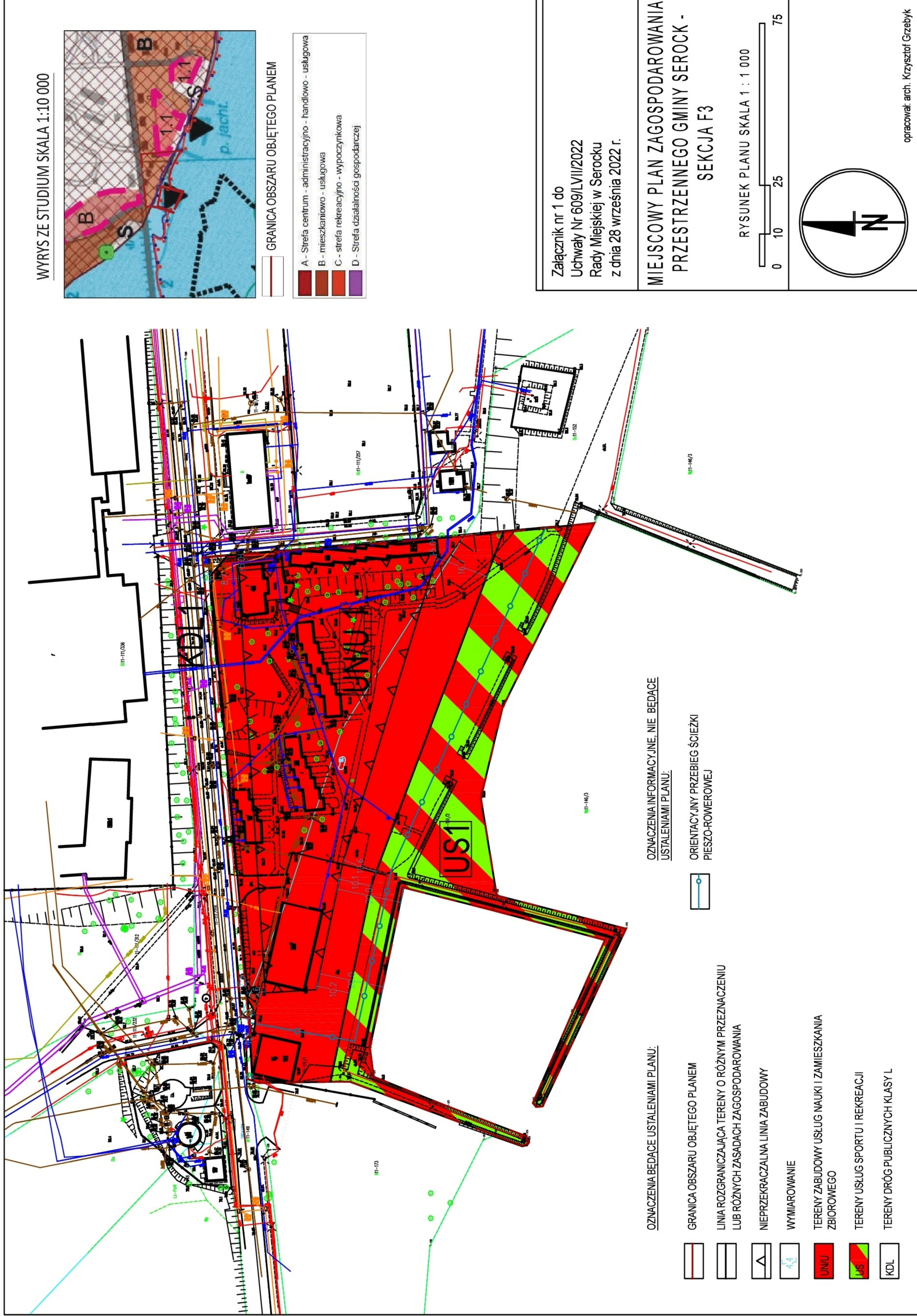
WYRYS ZE STUDIUM SKALA 1:10 000