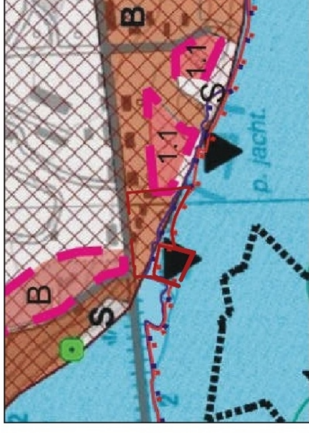
GRANICA OBSZARU OBJĘTEGO PLANEM